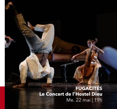
FUGACITÉS Le Concert de l'Hostel Dieu Me. 22 mai | 19h

Dim. 2 juin 2024 à 17h | Tarif C Condé-sur-l'Escaut | Église Saint-Wasnon