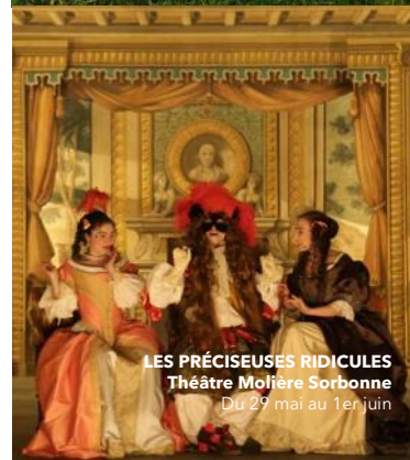
LES PRÉCIEUSES RIDICULES Théâtre Molière Sorbonne Du 29 mai au 1er juin