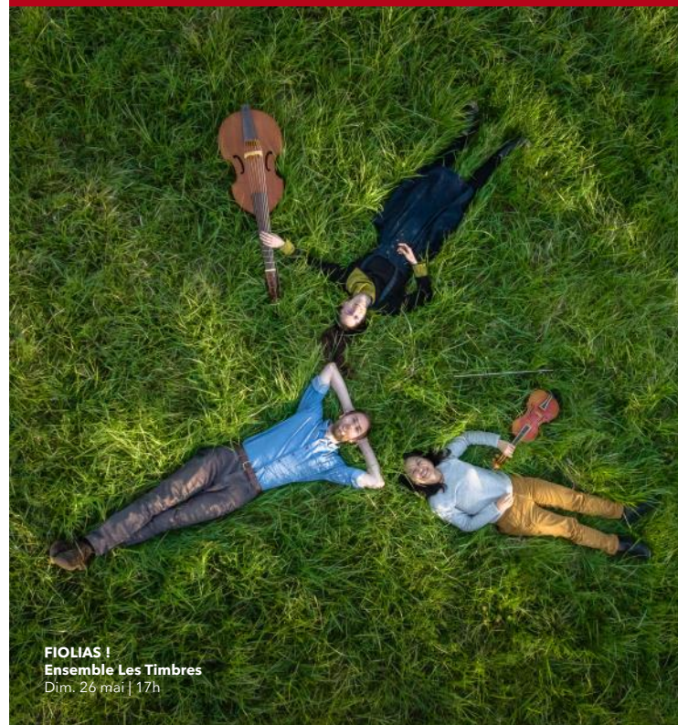
FOLIAS ! Ensemble Les Timbres Dim. 26 mai | 17h