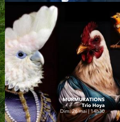
MURMURATIONS Trio Hoya Dim. 26 mai | 14h30