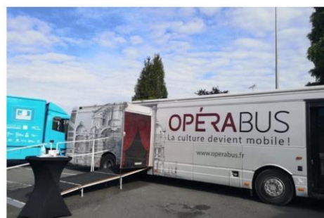
L'Opérabus participe à la 2e édition de Lille pour le Bien commun mardi 4 avril 2023 à Marcq (BAS Hourdeux/Croix du Nord)

Harmonia Sacra (dans le Valenciennois) veut rendre la culture mobile et accessible grâce à l'Opérabus, un opéra miniature itinérant unique en France dans un bus. 200 représentations sont ainsi données chaque année. Objectif : pérenniser l'Opérabus en 2023, restaurer sa mécanique et augmenter son action d'action, en se rendant davantage dans des communes rurales et les quartiers prioritaires.