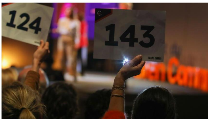
Marcq-en-Barœul, le 5 avril 2023: Nuit du bien commun à la Cité des échanges.

C'est une soirée d'enchères décidément pas comme les autres à laquelle plus de 700 personnes ont assisté mardi soir à la Cité des échanges de Marcq-en-Barœul. Son objectif : lever des fonds pour une dizaine d'associations du Nord et du Pas-de-Calais qui œuvrent à rendre notre monde meilleur.