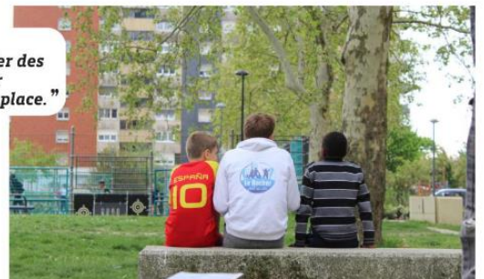
Le Rocher est déjà présent dans huit grandes villes de France. PHOTO ILLUSTRATION

+ SUR NOTRE SITE Une vidéo accompagne cet article à retrouver sur notre site Internet. Onglet Roubaix.