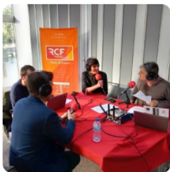
Emission en direct de la cité des échanges