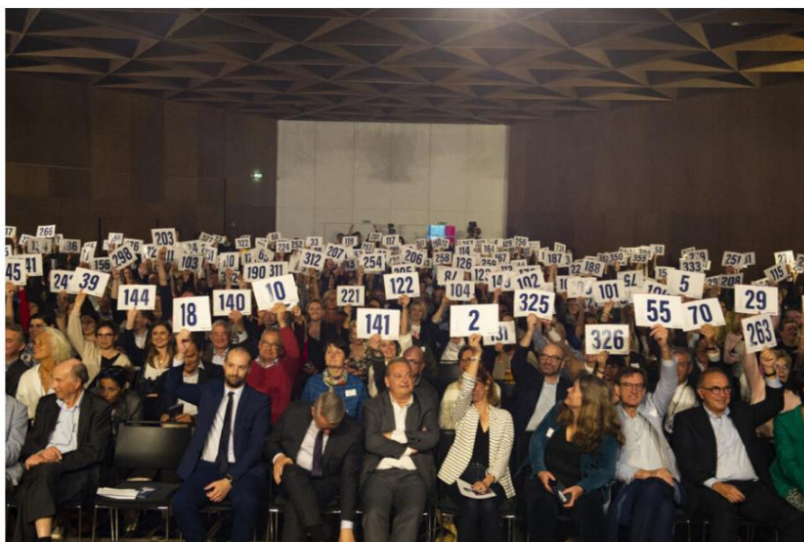
La première édition de Lille pour le Bien commun en 2022 a récolté 426 000 euros !

Lille pour le Bien commun vit sa 2e édition mardi 4 avril 2023 à Marcq-en-Baroeul. 10 associations ont 3 minutes pour se présenter, le public fait des dons. C'est ouvert à tous.