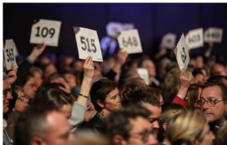
Lors de ce type de soirée, à un rythme effréné, dans une ambiance survoltée, la générosité s'exprime.

C'est une soirée d'enchères pas comme les autres à laquelle 700 personnes ont assisté mardi soir à la Cité des échanges de Marcq-en-Barœul. Son objectif : lever des fonds pour une dizaine d'associations du Nord et du Pas-de-Calais qui œuvrent à rendre notre monde meilleur.