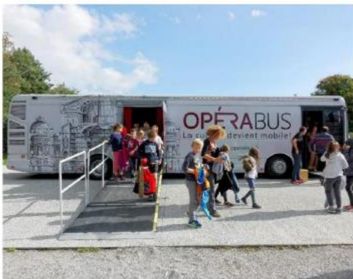
L'Opérabus est candidat à la Nuit du bien commun demain à Lille. Une soirée de levée de dons au service des acteurs du bien commun.

L'Opérabus n'était, en 2014, qu'à l'état embryonnaire. « Depuis 2015, l'Opérabus a beaucoup tourné, on a rencontré près de 40 000 habitants, sillonné près de 350 communes et donné 1300 re-