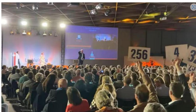
L'an passé, la première édition nordiste de la Nuit du Bien commun avait permis de récolter 400 000 euros de dons.

La deuxième édition de Lille pour le Bien Commun aura lieu le 4 avril à la Cité des échanges de Marcq-en-Barœul. Entreprises et particuliers philanthropes s'y retrouvent pour une soirée de dons au profit d'associations à impact positif sur la société.