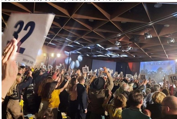
Le principe de Lille pour le Bien commun : voter et faire des dons pour 10 associations.

Lille pour le Bien commun est un événement co-fondé par Obole (société spécialisée dans la levée de fonds) et la Fondation de France.