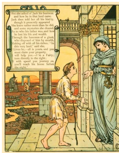
Illustration de Walter Crane pour le conte Jack et le Haricot Magique, 1890

Le mouvement Arts & Crafts , né en Angleterre à la fin du XIXème siècle s'inspire des formes artistiques anciennes de l'Antiquité grecque, du Moyen-Age (notamment du Gothique) et de la Renaissance italienne. Retrouvez-les dans les illustrations de Walter Crane pour le conte Jack et le Haricot Magique (éléments de costume, architecture, décoration intérieure, meubles, etc...)