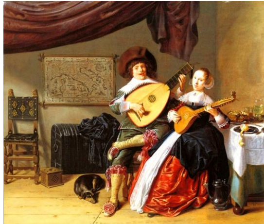
Jan Miense Mollenauer, le Duo